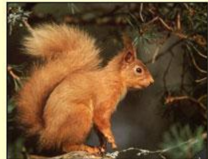
Gwiwer goch rhywogaeth brin sydd dan fygythiad