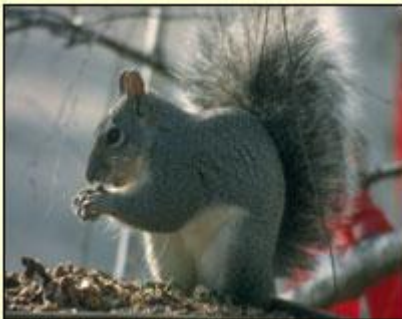
Gwiwer lwyd rhywogaeth lwyddiannus a chyffredin

Yn aml iawn mae gwiwerod yn rhannu nyth, yn enwedig yn y gaeaf, er mwyn rhannu gwres. Mae'r goedwig yn hynod bwysig i'r gwiwerod coch a llwyd ond fodd bynnag, mae'r wiwer coch sydd yn fychan ac ysgafn yn treulio llawer mwy o'i hamser yng nghanopi'r coed tra bod y wiwer llwyd sydd yn drymach ac yn gryfach, yn treulio llawer mwy o'i hamser ar y ddaear. Gan fod y wiwer llwyd yn defnyddio llwyni a thir mwy agored i chwilio am fwyd mae'n gallu lledaenu'n gyflym o un ardal i'r llall.