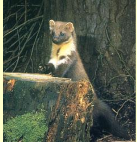
Bele'r coed ( Martes martes )

Dyma brosiect sydd yn cyfuno meysydd ecoleg, hanes a daearyddiaeth i olrhain hynt un o'n creaduriaid prinnaf.