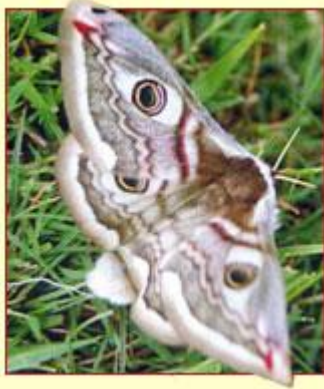
Gwyfyn yr ymerawdr

Mae pawb yn adnabod y glöyn byw, ond i'r rhan fwyaf o bobl, creaduriaid y nos sydd yn mynd sblat! ar sgrîn y car neu SSSS! ar y golau ydy gwyfynod – a dyna'r cyfan. Mae'r hen enw "pry kannwyll" yn dal i'w glywed ond nid ydym yn gwybod llawer am wyfynod – er enghraifft, pryd maen nhw'n ymddangos, effaith tywydd ar eu niferoedd, ac ar beth maen nhw'n bwydo.