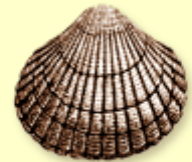
3. Cragen fylchog