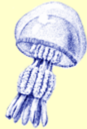
1. Sglefren fôr

Pa rai sydd yn blanhigion a pha rai sydd yn anifeiliaid?