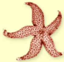
4. Seren fôr