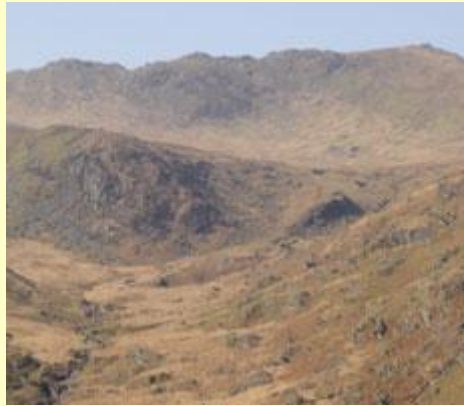
Tarddle – ucheldir garw, corsiog uwchben Blaenau Dolwyddelan Cyfeirnod: 683494

Lluniau o rannau allweddol o daith Afon Lledr o'i tharddle i'w chymer ag Afon Conwy.