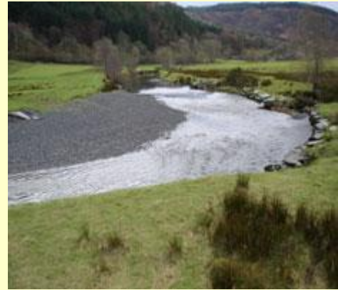
Sianel yr afon ger Dolwyddelan Cyfeirnod: 745526