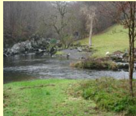
Cymer Afon Lledr ac Afon Conwy. Mae Afon Lledr yn llifo o'r dde. Cyfeirnod: 798543