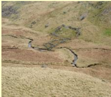
Ystumiau ar un o lednentydd Afon Lledr. (Sylwch ar yr hen gorlannau.) Cyfeirnod: 701492