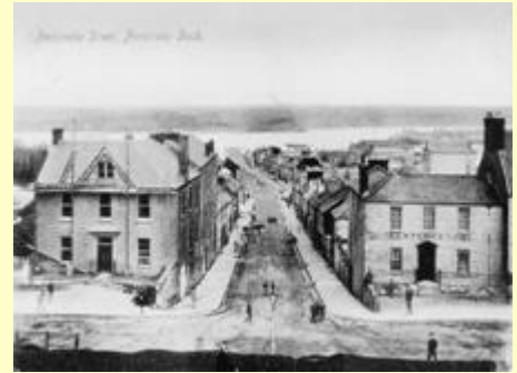
Stryd Penfro, Doc Penfro. Marc post: Rhagfyr 23 1905