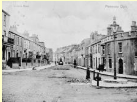
Heol Fictoria, Doc Penfro

Dyma ddau hen gerdyn post yn dangos dwy o strydoedd Doc Penfro rhywbryd rhwng diwedd yr 1890au a chanol y 1900au.