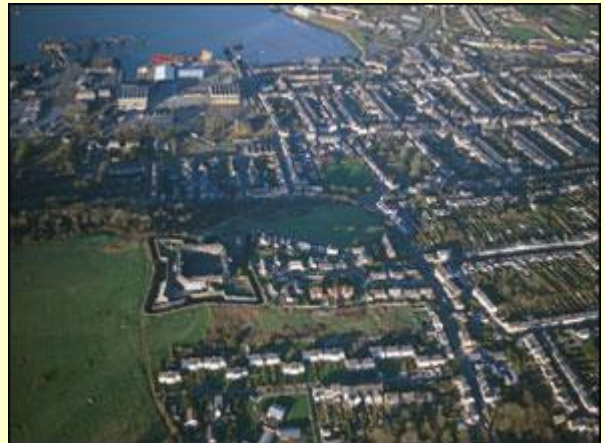
© Y Goron. Cedwir pob hawl. CBHC. Doc Penfro yn 2001

Yn gynnar yn y bedwaredd ganrif ar bymtheg roedd angen llongau rhyfel newydd ar y Llynges Frenhinol a phenderfynwyd sefydlu iard longau mewn lle bach o'r enw Pater, lle mae Doc Penfro heddiw. Dechreuodd y gwaith o adeiladu'r iard ym 1814 gyda baracs i'r milwyr oedd yn gwarchod yr iard longau a'r aber i lawr at y môr.