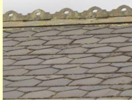
Llechi o'r 19eg ganrif, y crawiau yn denau a'r naddu'n gywrain