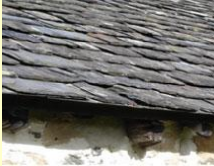
Llechi trwchus, garw, ar do un o eglwysi hynaf y wlad