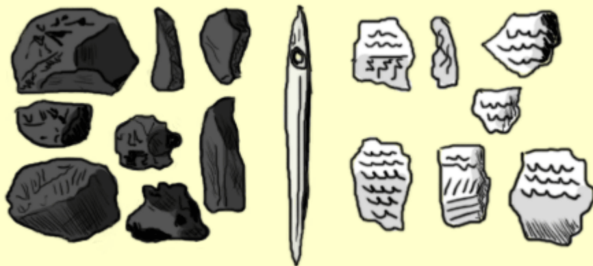
Ysgrafelli fflint o Niwbwrch

Ar Ynys Môn mae tomenni sbwriel yn cynnwys tystiolaeth o rai o'r pentrefi cynharaf ar yr ynys. Yn ne orllewin yr ynys cafwyd hyd i lawer o domenni cregyn môr yn yr ardal rhwng Niwbwrch ac Ynys Llanddwyn sydd erbyn hyn wedi eu gorchuddio â phlanhigfeydd conifferau. Mae llawer o'r tomenni mewn ardal sydd hefyd wedi datguddio esgyrn wedi eu ffosileiddio, cerrig fflint, offer cerrig a chrochenwaith. Gwaith anodd yw dyddio'r tomenni oherwydd nad yw pob un o'r darganfyddiadau yr un oed. Mae rhai o'r fflintiau yn dyddio'n ôl i'r Cyfnod Mesolithig rhwng 7,000 a 9,000 o flynyddoedd yn ôl, tra bod y crochenwaith o fath a elwir y Diodlestri, yn dyddio mae'n debyg o tua 4,000 o flynyddoedd yn ôl. Yr unig ddarganfyddiad a gafwyd yn uniongyrchol yno o domen sbwriel yw nodwydd asgwrn y credir ei bod tua 5,000 o oed. Prif gynnwys y tomenni yw cregyn cocos ac efallai iddynt gael eu defnyddio dros gyfnod maith. Hyd yn oed heddiw, mae pobl leol yn dal â hawliau hel cocos ar y traeth.