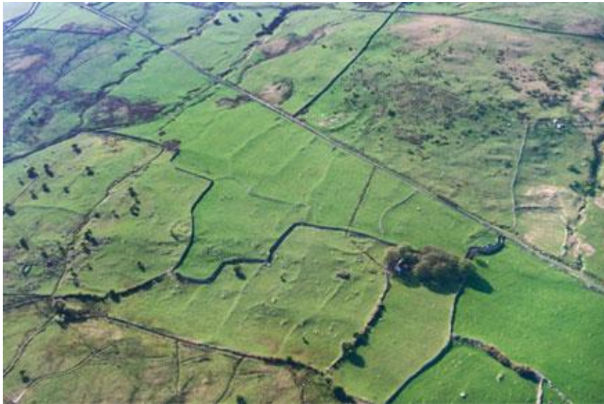
Llun:DI2007_1430 Maen y Bardd, Conwy.

Dyma awyrlun sy'n dangos systemau caeau cynhanesyddol ger Maen y Bardd, Conwy. Hen gromlech claddu'r meirw yw Maen y Bardd. Yn y llun gallwn weld olion wahanol gyfnodau. Fedrwch chi eu gweld? Talwch sylw....mae yna dasg i chi ei wneud ar ddiwedd y daflen. Fedrwch chi weld waliau cerrig a godwyd yn ystod y ddwy ganrif diwethaf? Dyma ffiniau'r caeau sy'n parhau i gael eu defnyddio hyd heddiw. Dylai'r hain fod yn amlwg ar y tir.