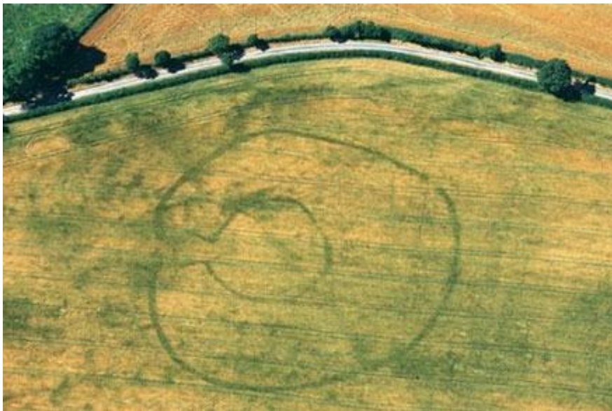
© Hawlfraint y Goron: Comisiwn Brenhinol Henebion Cymru Llun:2005_0139. NPRN 308918 Cawrence, Ceredigion

Gellir dod o hyd i nifer o hen ffermydd a safleoedd hanesyddol drwy astudio olion cnydau mewn awyrluniau. Er enghraifft, mae ôl cnydau'n gallu dangos amlinelliadau clir o ffosydd fferm amddiffynedig o'r Oes Haearn, fel y gwelir yn y llun isod o Cawrence, Ceredigion.