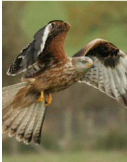
Y Barcud Goch

Ers hynny mae'r boblogaeth wedi ffrwydro ac erbyn 2005 roedd yna 500 par yng Nghymru. Maent yn adar gwerth eu gweld ac yn amlwg iawn yn y canolbarth.