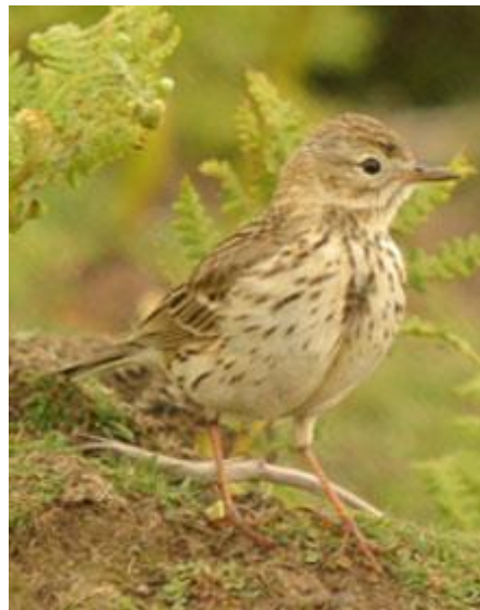
Corhedydd y waun

Dim rhyfedd fod ei boblogaeth yn dirywio cymaint.