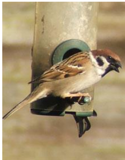
Aderyn y to